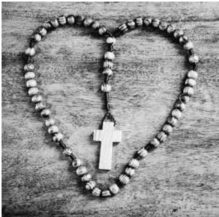
SB Foto: SB

Kontakt: Silke und Klaus Bruder, (0 78 05) 9 16 70 04