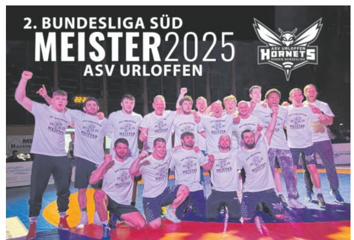
Die Meistermannschaft des ASV Urloffen

Erste Mannschaft des ASV Urloffen sichert sich den Meistertitel in der 2. Ringerbundesliga Süd. Perspektivteam steht aktuell auf dem dritten Tabellenplatz der Oberliga Südbaden.